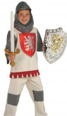
SE DEGUISER EN CHEVALIER