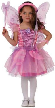
SE DEGUISER EN FEE