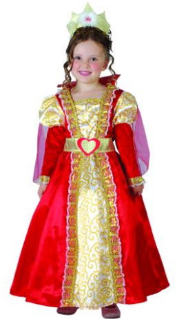
SE DEGUISER EN PRINCESSE