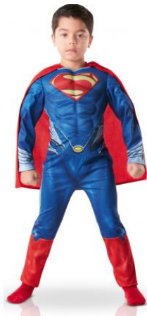
SE DEGUISER EN SUPER HERO